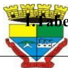
1. Tabela 1